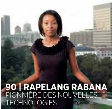
90 | RAPELANG RABANA PIONNIÈRE DES NOUVELLES TECHNOLOGIES