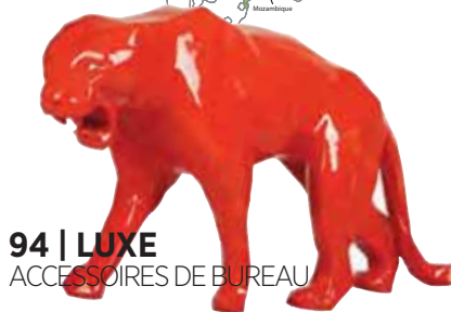
94 | LUXE ACCESSOIRES DE BUREAU