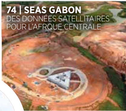
74 | SEAS GABON DES DONNÉES SATELLITAIRES POUR L'AFRIQUE CENTRALE